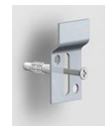
SUPPORT MURAL - vis et cheville non fournie se fixe au mur quantité 2